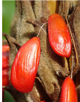
Fruit sec et graines

Leur germination semble assez difficile (plusieurs centaines de graines mises en stratification puis en terre n'ont donné que deux pieds). Il est toujours possible de reproduire le magnolia à grandes fleurs par marcottage, d'autant que les branches se développent