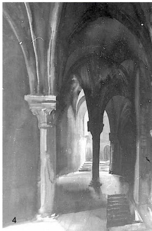
Fig.4 ci-contre - vue de l'intérieur du Mont-St-Michel, grand lavis à l'encre noire (h ≈70 cm).

Decaris excellait également dans les grands lavis et les lavis-aquarelles, qu'il utilisait souvent pour préparer ses gravures.