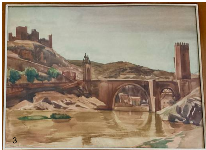
Fig.3 ci-dessus - Lavis-aquarelle, représentant le pont d'Alcántara à Tolède (45x63 cm).

Albert Decaris 1901 - 1988 fut un buriniste 1 renommé pour sa virtuosité. Premier prix de Rome de gravure en 1929, il grava plusieurs centaines de timbres poste à l'époque où ceux-ci étaient réalisés par gravure sur cuivre.