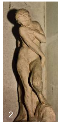
Fig.2 - Nu féminin, terre cuite, h≈35 cm

Une demi-douzaine de terres-cuites de même inspiration ornaient les différentes pièces du Logis Delugré.