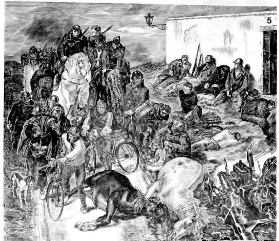
La reraite de 1940 , gravure, env. 90x100 cm

Cette femme terrorisée à la porte de sa maison (fig.4, gravure burin et taille douce, 40x50 cm) imprimée par les Bricage, évoquait sans doute pour l'artiste les sentiments des habitants de nos contrées soumis aux malheurs des guerres du XX e siècle. Comme la grande gravure du salon que les Blaisonnais ont bien connu et qu'il faut reproduire encore une fois ici tant elle est impressionnante (document page suivante). Elle se trouve déjà dans la brochure du Sablier sur L'Atelier Bricage .