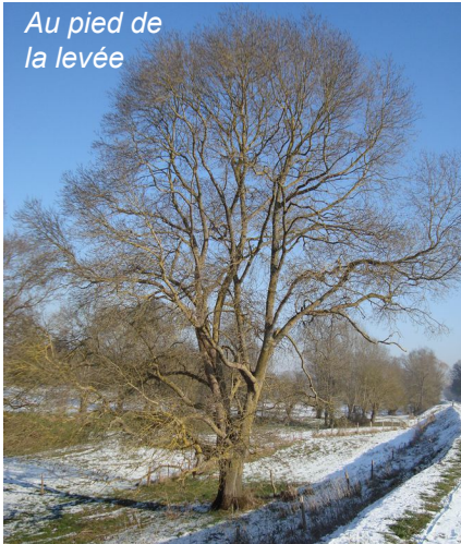
Au pied de la levée

millénaires voire même des dizaines de milliers d'années. Lors des glaciations de l'ère quaternaire, ils ont migré vers le sud, à l'abri des très grands froids. Après disparition des glaciers ils ont recolonisé des territoires nordiques, abandonnant maintenant les climats méditerranéens, qui ne leur proposent pas l'humidité dont ils ont besoin.