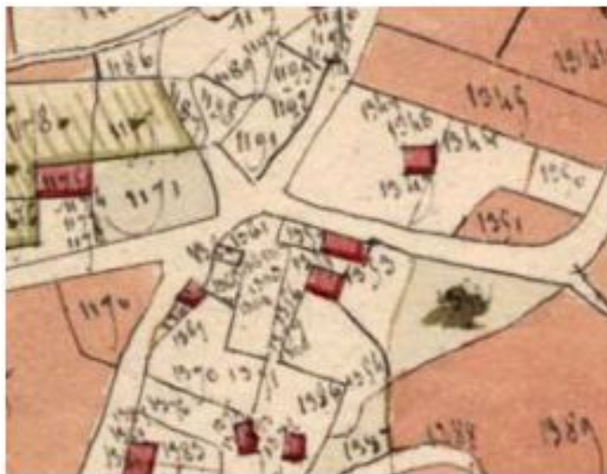
Extrait de l'Atlas cantonal de 1809

C'est donc sur une période assez courte que le centre du hameau de Raindron s'est ainsi structuré. On peut penser que le développement de la classe dite « bourgeoise » à la suite de la disparition de l'ancien régime entraîna la structuration du centre du hameau avec des éléments de cohésion sociale nouveaux : club de loisir et de réunions amicales pour la boule de fort, approvisionnement extérieur de denrées alimentaires avec l'épicerie et service partagé avec le forgeron/maréchal-ferrant, très utile avec la généralisation du cheval comme moyen de transport aussi bien des marchandises que des personnes. La distante de 6 km séparant Raindron du bourg de Blaison justifia, jusqu'à la généralisation du déplacement automobile, l'existence d'un tel centre.