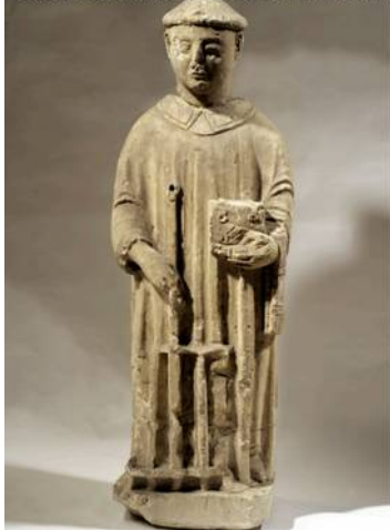
Statue de saint Laurent en tuffeau (H-108cm)